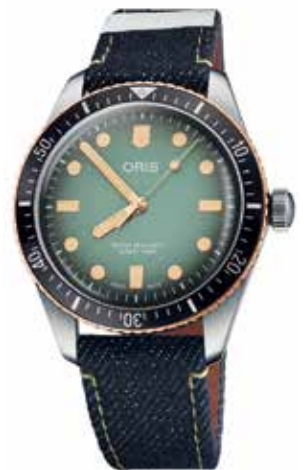
Oris x Momotaro